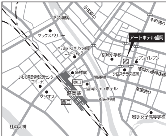
盛岡会場：アートホテル盛岡