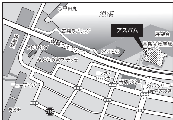
青森会場：青森県観光物産館アスパム

【アクセス】○JR仙台駅西口 徒歩2分 ○JR仙石線「あおば通」 徒歩5分 ○地下鉄南北線「広瀬通」 徒歩5分