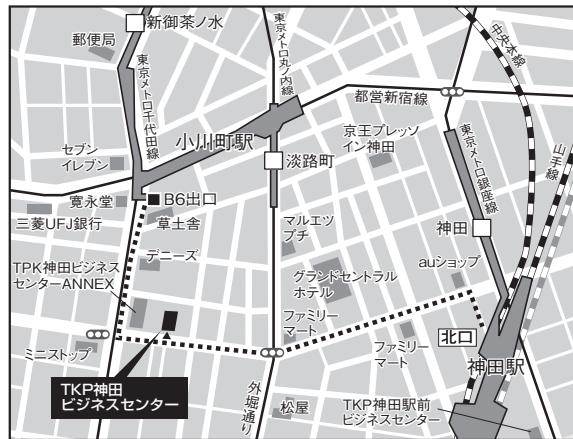
東京会場：TKP神田ビジネスセンター

【アクセス】○JR山手線 神田駅北口 徒歩5分 ○都営新宿線 小川町駅 出口B6 徒歩3分